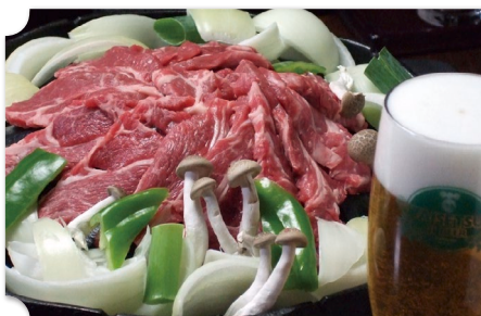
旭川 大雪地ビール館