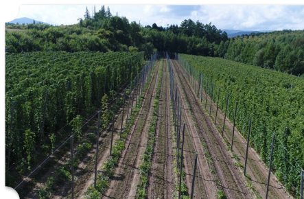
上富良野 観光タクシーで各所巡り