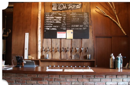
美深 美深白樺ブルワリー