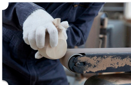
美深 木工クラフト体験