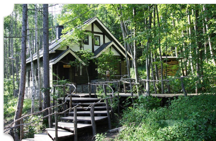
富良野 珈琲 森の時計