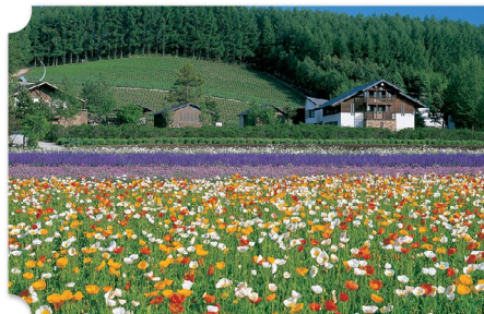
中富良野 ファーム富田