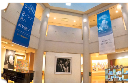
旭川 三浦綾子記念文学館 外国樹見本林