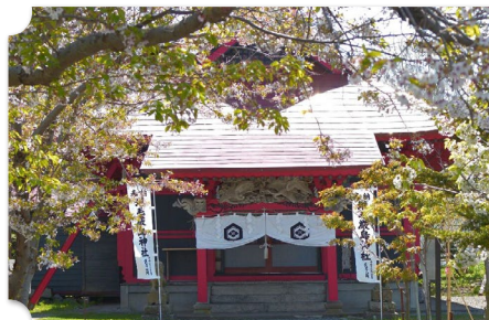
増毛 増毛厳島神社