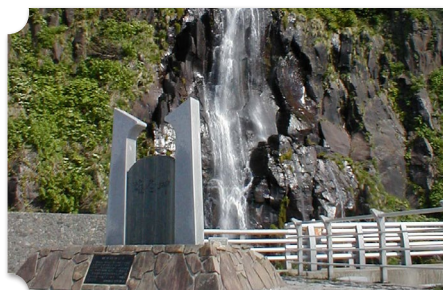
石狩 雄冬岬展望台 白銀の滝