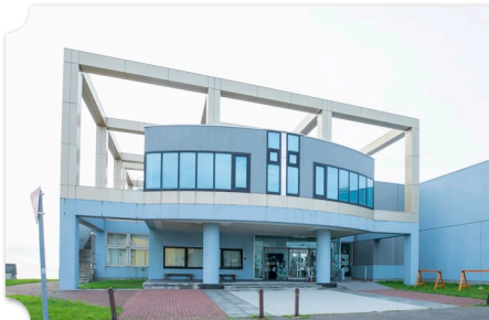
留萌 海のふるさと館