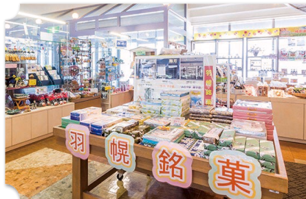
羽幌 道の駅 ほっと♡はぼろ