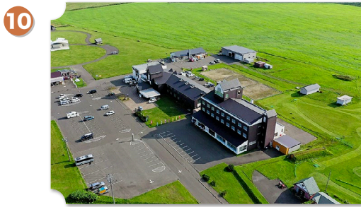
猿払 道の駅 さるふつ公園

猿払村村営牧場の一角にある公園。目の前のオホーツク海と後方の牧草地を望むことができ、名産品であるホタテを食べられるレストランも敷地内にあります。