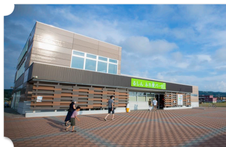
留萌 道の駅 るもい