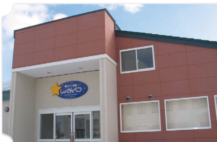
初山別 道の駅 ロマン街道しょさんべつ