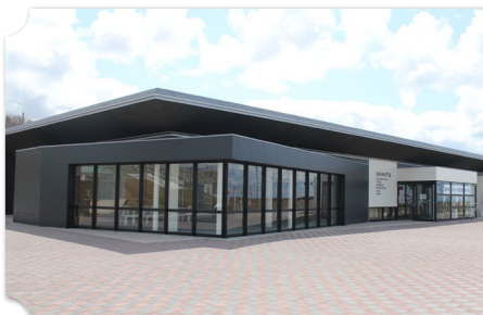
遠別 道の駅 えんべつ富士見