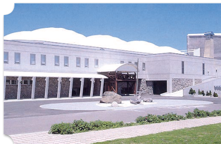
苫前 道の駅 とままえ温泉ふわっと