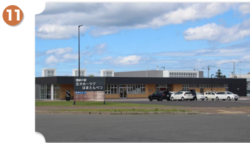
浜頓別 道の駅 北オホーツクはまとんべつ

新しくオープンした地域住民にも観光客にも利用しやすい道の駅。特産品の販売の他、カフェスペースやイベントスペースもあります。