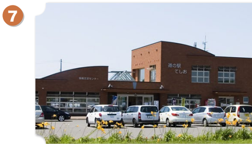
天塩 道の駅 てしお

利尻富士が彼方に見える、レンガを基調に作られた道の駅です。天塩の特産品であるしじみを使ったラーメンやカレーを味わうことができます。