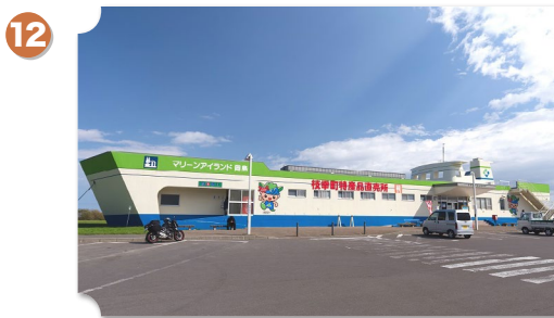
枝幸 道の駅 マリーンアイランド岡島

大きな船の形をした道の駅で、枝幸で獲れた新鮮な海産物を味わうレストランや売店もあります。隣接した砂浜でレジャーを楽しむこともできます。