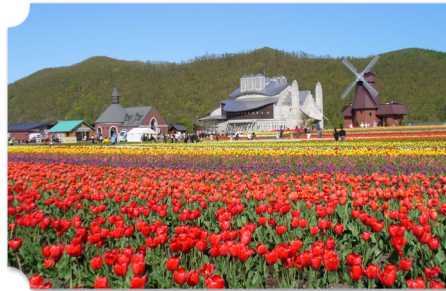
上湧別 かみゆうべつ チューリップ公園