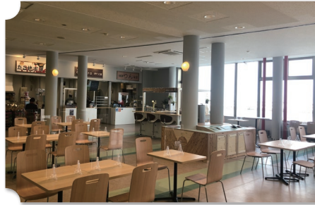
紋別 紋別海洋交流館