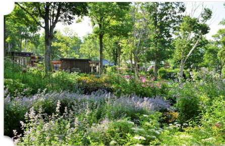
上川 大雪森のガーデン