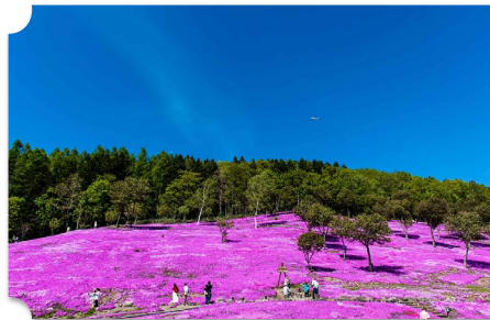
滝上 芝ざくら滝上公園