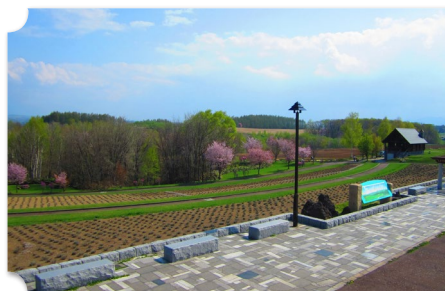
美瑛 北西の丘展望公園