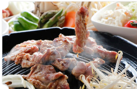
中富良野 富良野ジンギスカン ひつじの丘