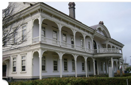
旭川 旭川市彫刻美術館