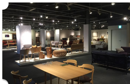
旭川 旭川デザインセンター