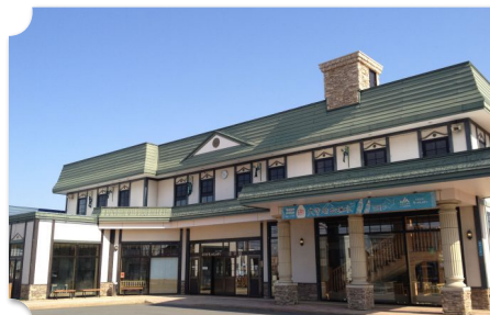
東川 道の駅 ひがしかわ「道草館」