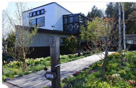
由仁 キッチンファームヤード