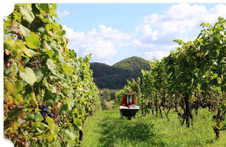
岩見沢 宝水ワイナリー