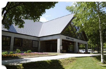
富良野 富良野チーズ工房