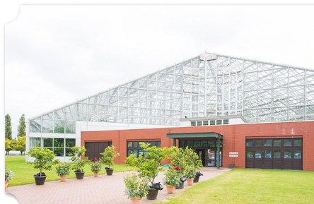
岩見沢 いわみざわ公園バラ園