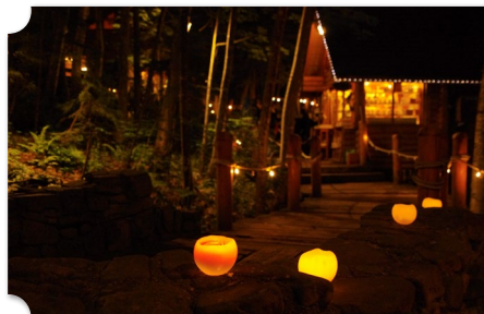
富良野 新富良野プリンスホテル周辺 ニングルテラス